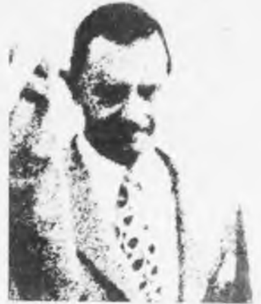
"Los Osinde" son los promotores

3) Conclusiones: Las agrupaciones abajo firmantes repudiamos estos hechos por atacar contra el funcionamiento democrático del movimiento estudiantil, pretendiendo imponer mediante métodos fascistas sus objetivos antipopulares, e impedir la libertad de expresión y la libertad ideológica.