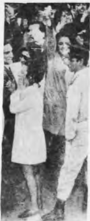
Los distritos combativos en primera línea de combate.

■ El jueves 12 de julio, las Uniones de Educadores de La Matanza, de Almirante Brown, Lomas de Zamora, Círculo de Educadores de Avellaneda, con 500 docentes pertenecientes fundamentalmente a las dos primeras organizaciones ocuparon la sede de la Federación de Educadores Bonaerenses "Domingo F. Sarmiento", con el fin de recuperar dicho sindicato para sus legítimos dueños: los trabajadores de la educación.