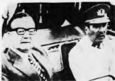
Allende-Prats. El pacto con los militares es el objetivo de la desmovilización promovida con el triunfo antigolpista.