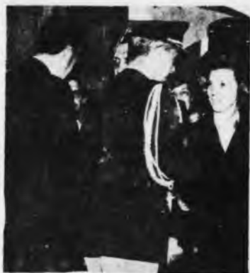
Perón con Carcagno y López Rega con Gelbard. Artífices del "GAN"