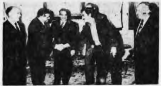
El VICEGOBERNADOR cordobés y titular de la regional de la central obrera de la provincia, Atilio López, estrecha la mano del secretario de la C.G.T. nacional, José Rucci, señalando así el acuerdo logrado en el conflicto político-gremial. Asisten a la escena, el presidente Lastiri (en el centro), el ministro Lambi (a la izquierda) y el dirigente militante Miguel (a la derecha).

■ Inmediatamente de producida la caída de Cámpora, los Osinde y los Rucci largaron una ofensiva contra la Regional Córdoba. Bandas armadas asaltaron los locales de la CGT cordobesa, de Luz y Fuerza y del Smata. Carcagno viajó especialmente a Córdoba para discutir y poner en práctica el operativo contra Córdoba.